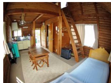
長柄町農村交流センターログハウス

融資金額：996 万円 ・元利一括返済 ・金利 1.5% ・期間 8 ヶ月 2019 年 9 月融資実行