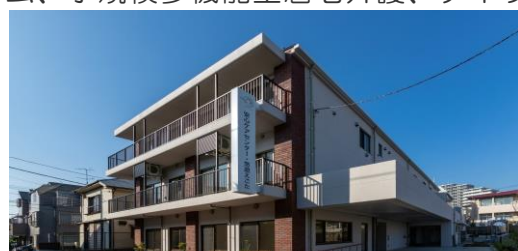
新施設：安心ケアセンター・悠遊えごた