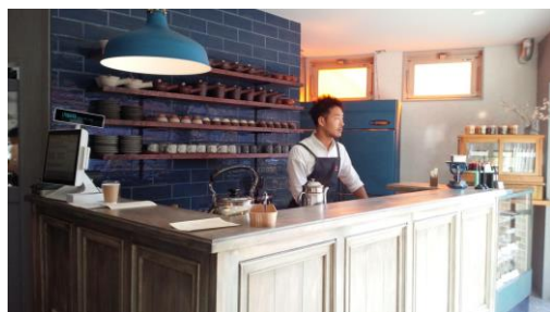
胡桃堂のテイクアウト用カウンター

西国分寺のクルミドコーヒーに続き、2017年国分寺に胡桃堂喫茶店を開店。飲食業界は厳しい。初年度からの成長率は20%、来客数90人/日。地産地消の食材として地元の野菜(コクベジ)も使っている。大切な思いを持っている本を各自持ち寄り売る古書店部分で本の循環を図っている。地域通貨「ぶんじ」を使っているぶんじ食堂も地域と連携して行っている。